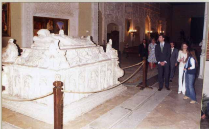
▲ Capilla de San Ildefonso en la Universidad de Alcalá de Henares. Sepulchro de Cisneros.