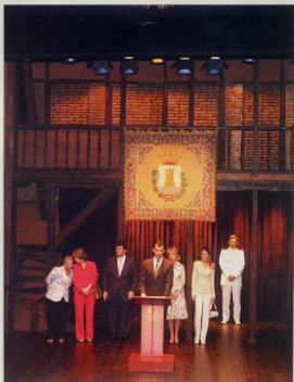
▲ Momento del discurso de Don Felipe en el Corral de Comedias.