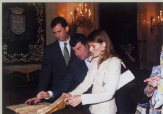
Los Príncipes admiraron los importantes documentos históricos de Alcalá. ▲

Y para conmemorar esta primera visita oficial de los Príncipes de Asturias a la ciudad complutense, el Alcalde del Municipio, Bartolomé González y la Presidenta de la Comunidad de Madrid, Esperanza Aguirre, les entregaron el título de "Visitantes Ilustres de Alcalá de Henares" y varios obsequios como una edición especial de El Quijote ilustrada por Eustaquio Segrelles, dedicada por el autor, realizada con motivo de la conmemoración en 2005 del IV Centenario de la Publicación de la inmortal obra de Miguel de Cervantes; y otra edición de El Quijote manuscrita, en este caso, por escolares de todos los colegios de la ciudad complutense para la Infanta Leonor.