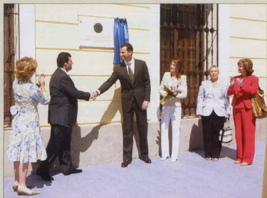
Los Príncipes ante la placa de honor, saludan al Alcalde. ▲