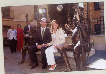
Junto a la escultura de Don Quijote. ▲