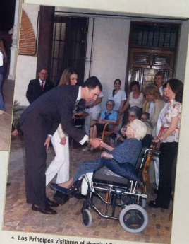
▲ Los Príncipes visitaron el Hospital Benéfico de Antezana.