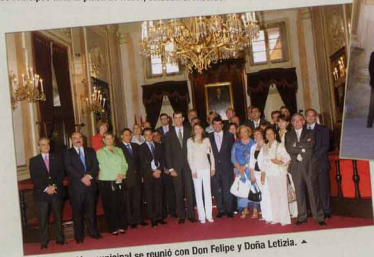
La Corporación municipal se reunió con Don Felipe y Doña Letizia. ▲