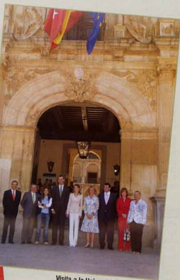
Visita a la Universidad alcalaína. ▲