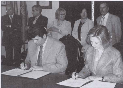
El alcalde y la presidenta de la Asamblea de Madrid firman el convenio